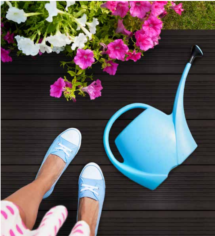
➔ GroJaNatural in Dunkel