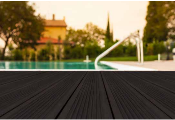
➔ GroJaNatural in Dunkel